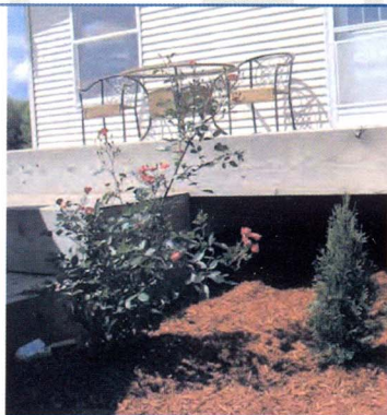
استفاده در زیر سازه های چوبی برای جلوگیری از رشد علف هرز