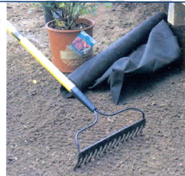
۱- پاکسازی سطح خاک از علف هرز