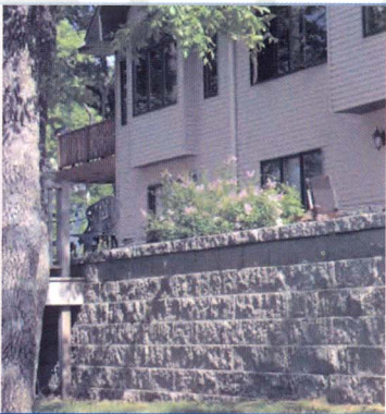
استفاده در دیوار ها جهت جداسازی و زهکشی