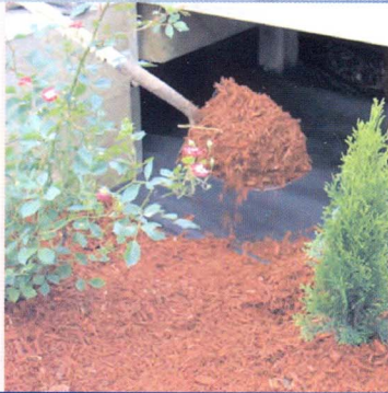
۳- پوشش منسوج با کود گیاهی، خاک یا شن به ارتفاع حدود ۶-۷ سانتی متر