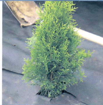
۲- برش منسوج به اندازه های دلخواه و پوشش دادن اطراف گیاه بطور کامل